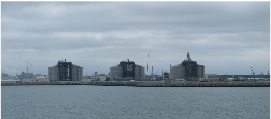
Therminol raffinerie de Douzege

La nouvelle loi française relative au devoir de vigilance des sociétés mères et entreprises donneuses d'ordre 2 , entrée en vigueur en mars 2017 après un long parcours parlementaire, montre que la prévention des risques de violations des droits humains et des dommages environnementaux peut constituer une obligation légale pour les multinationales. Cette loi permet enfin d'appréhender la complexité juridique des groupes de sociétés ainsi que la multiplicité des relations commerciales qu'elles peuvent entretenir avec d'autres acteurs économiques.