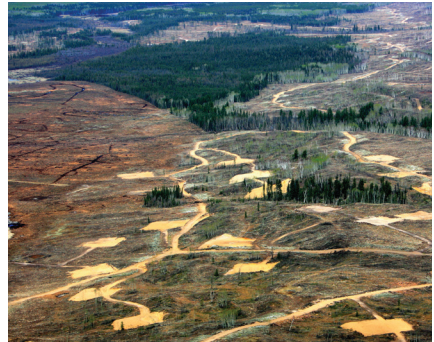
Sables d'Alumineux (Canada)

Cette notion couvre ainsi tous les types de relations entre professionnels, définies comme des relations régulières et stables, avec ou sans contrat, avec un certain volume d'affaires et dont on s'attend raisonnablement à ce qu'elle soit durable. L'article L. 442-6, I, 5° du Code de commerce s'applique également à l'achat et à la vente de produits et à la prestation de services. Les sous-traitants et fournisseurs peuvent être ceux de la société-mère comme ceux des filiales ou sociétés contrôlées.