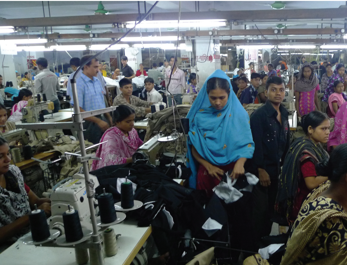
Bangladesh - Atelier - © Clean clothes campaign