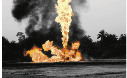
Traçage de gaz (Nigeria)

Selon les informations les plus récentes disponibles au moment de la publication de la loi, environ 150 grandes multinationales établies en France seraient ainsi concernées.