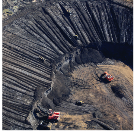
Sables bitumineux (Canada)

Les premières actions en justice seront possibles à compter de la publication du rapport portant sur le premier exercice ouvert après la publication de la loi, c'est-à-dire en 2019 .