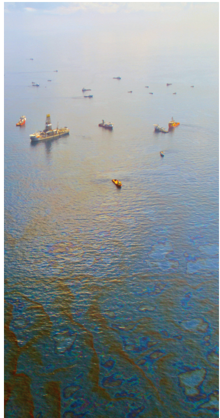
Explosion de la plateforme pétrolière Deepwater Horizon.

La troisième session de négociations à Genève, du 23 au 27 Octobre 2017 ouvre une étape décisive, puisque sera discutée une première proposition écrite de Traité, présentée par l'Équateur. En vue de cette prochaine session, l'Alliance pour un Traité a élaboré une nouvelle déclaration, avec l'objectif de récolter 2000 signatures d'organisations, mouvements sociaux et personnalités à travers le monde, afin de faire pression sur les États réticents tels que l'Union européenne et ses États membres, dont la France 20 .