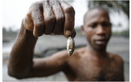
Fidemenas showing effect of oil pollution in local creek. Go: © Motern van Dijk_Milieudefensie

Contrairement à d'autres initiatives législatives, sectorielles ou limitées au niveau européen ou dans d'autres pays (secteur extractif, lois anti-corruption, travail des enfants etc.), la loi française sur le devoir de vigilance des multinationales est aussi unique en son genre car elle couvre tous les secteurs d'activité, et un large domaine d'application . Ainsi, sont concernées les « atteintes graves envers les droits humains et les libertés fondamentales, la santé et la sécurité des personnes ainsi que l'environnement ».