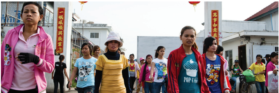
Ensemble de femmes - © Morini De Wels