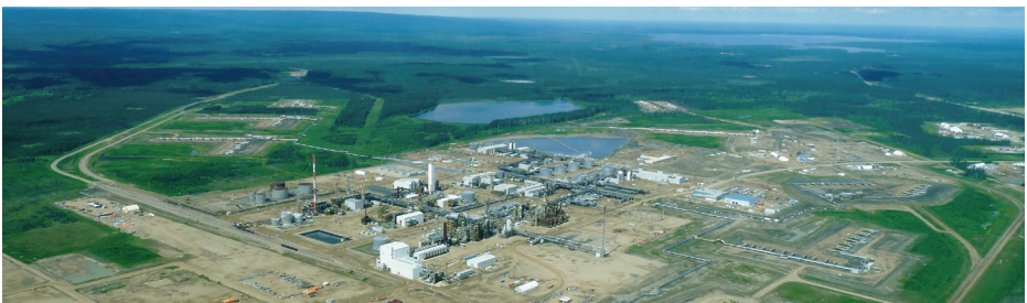
Sables Bluminioux (Canada)