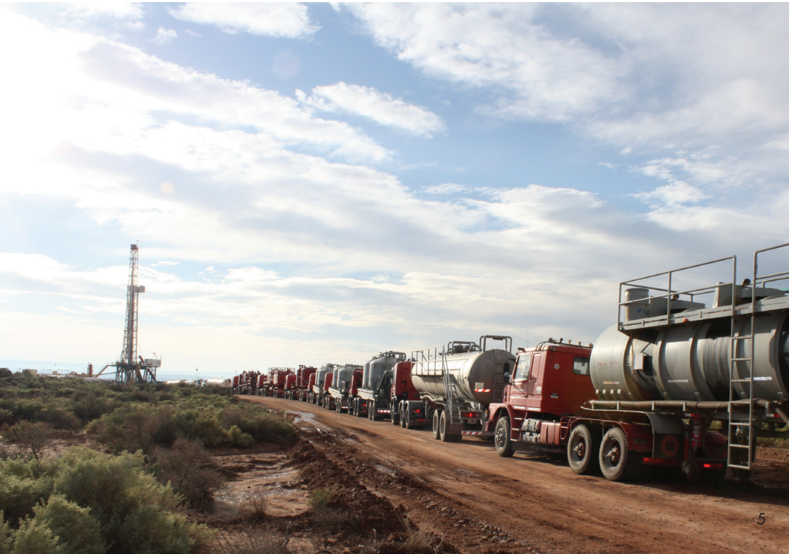
Puits de gaz de schiste (Argentine)