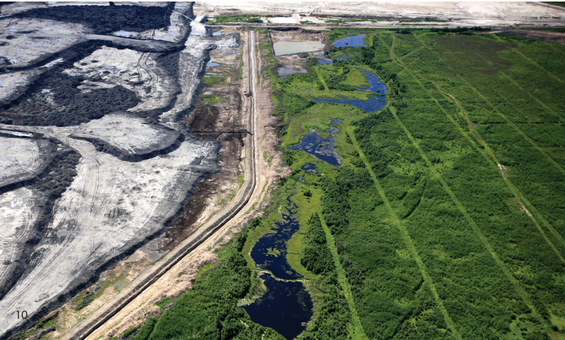
Sables bitumineux (Canada)