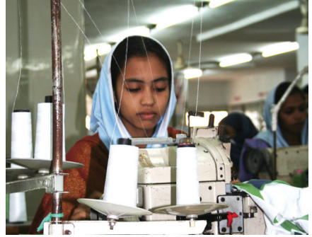
garment worker bangladesh

Pour plus d'éléments sur les avancées en Europe : http://forumcitoyenpouarlarse.org/infographie-sur-le-devoir-de-vigilance-en-europe-nouvelle-publication-du-fcrse/