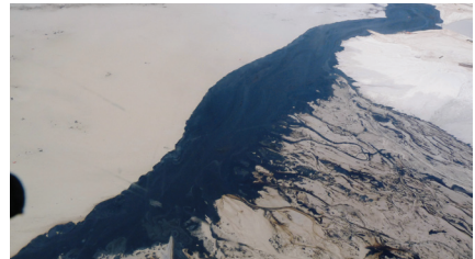
Sables Bluminioux (Canada)

Bien qu'un décret en Conseil d'État puisse préciser le contenu du plan et les modalités de son élaboration et de sa mise en œuvre, il est important de noter que ce décret est facultatif, la loi s'applique donc déjà, même en l'absence d'un décret.