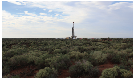
Puits de gaz de schiste (Argentine)

Le fait d'instaurer légalement une obligation de vigilance pour les entreprises en matière de droits humains devrait contribuer à donner progressivement la priorité aux risques pour les personnes et l'environnement plutôt qu'aux profits pour les entreprises.